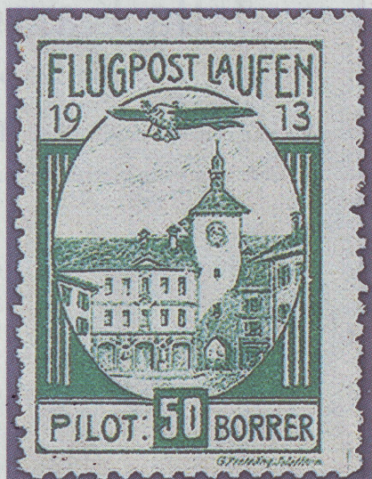
Die damalige Flugpostmarke: Zu sehen an der Briefmarkenausstellung.

die Ehre erweisen andererseits aber auch seine Philatelistenfreunde vom Schweizerischen Aerophilatelisten-Verein (SAV), welche sich entschlossen haben die diesjährigen Tage der Aerophilatelie dieses Jahr in der Region durchzu-